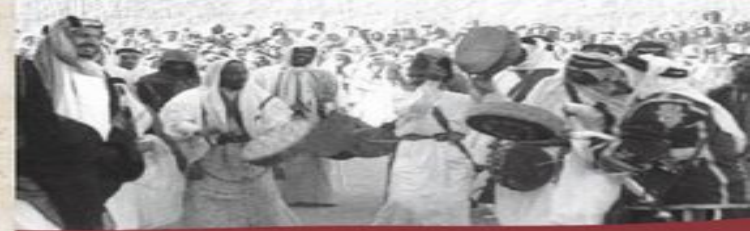
الملك عبدالعزيز وهو يؤدي العرضة السعودية

يوم بدينا ثلاثة قرون من الأصالة والعراقة FOUNDINGDAY.SA