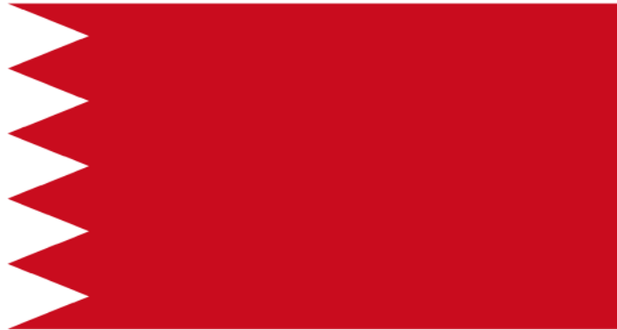
عَلم ملك مملكة البحرين