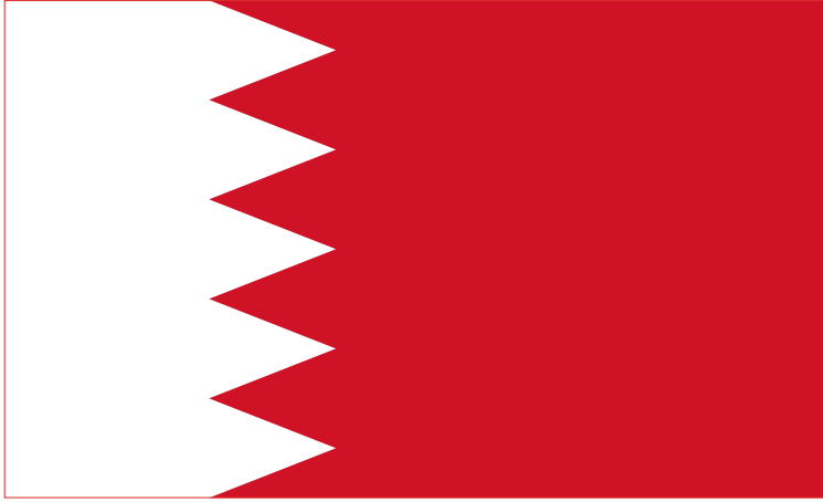
عَلَم مملكة البحرين الحالي