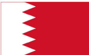
عَلَم مملكة البحرين من عام 2002 إلى الآن