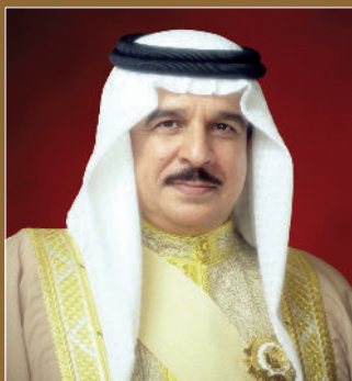
حضرة صاحب الجلالة الملك حمد بن عيسى آل خليفة ملك مملكة البحرين المفدى حفظه الله ورعاه