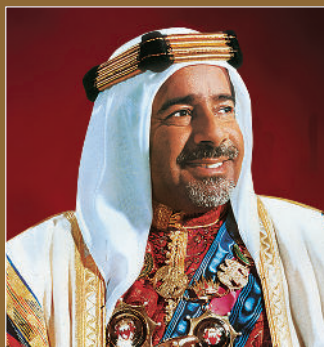
المغفور له بإذن الله تعالى الأمير الراحل الشيخ عيسى بن سلمان آل خليفة طبيب الله ثراه