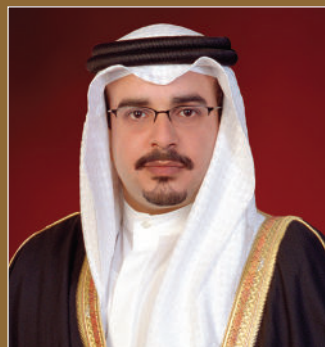
صاحب السمو الملكي الأمير سلمان بن حمد آل خليفة ولي العهد رئيس مجلس الوزراء حفظه الله